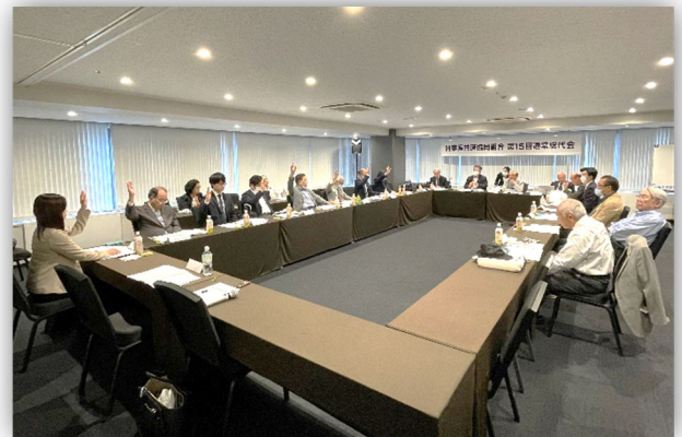
第15回通常総代会の様子

その結果、2023年度（第15期）事業報告・決算報告・剰余金処分案、2024年度（第16期）事業計画案・収支予算案等の全11議案が賛成多数で可決されました。このうち第10号議案「開業医休業保障制度普通共済約款の一部変更の件（共済契約口数の限度の変更）」では、開業医休保における保障拡大の制度改定を決定しました。